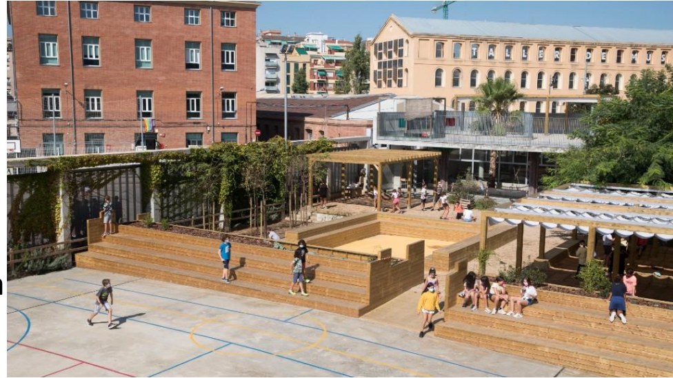
Escola Can Fabra Refugi climàtic (Imatge de la web del Consorci d'Educació de Barcelona)