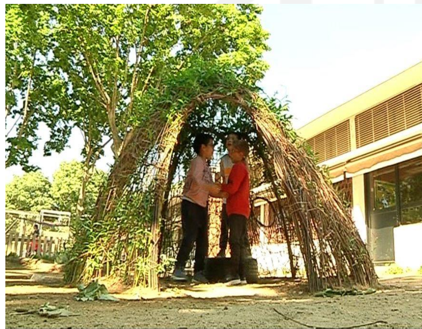
Escola Baró de Viver (imatge de la web de Betevé)