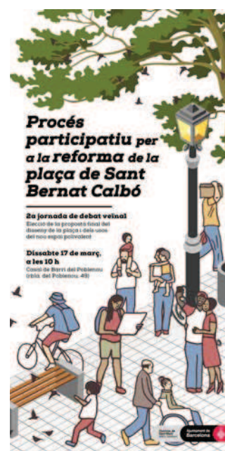
Cartells per a la difusió dels tallers amb la gent gran i les sessions obertes