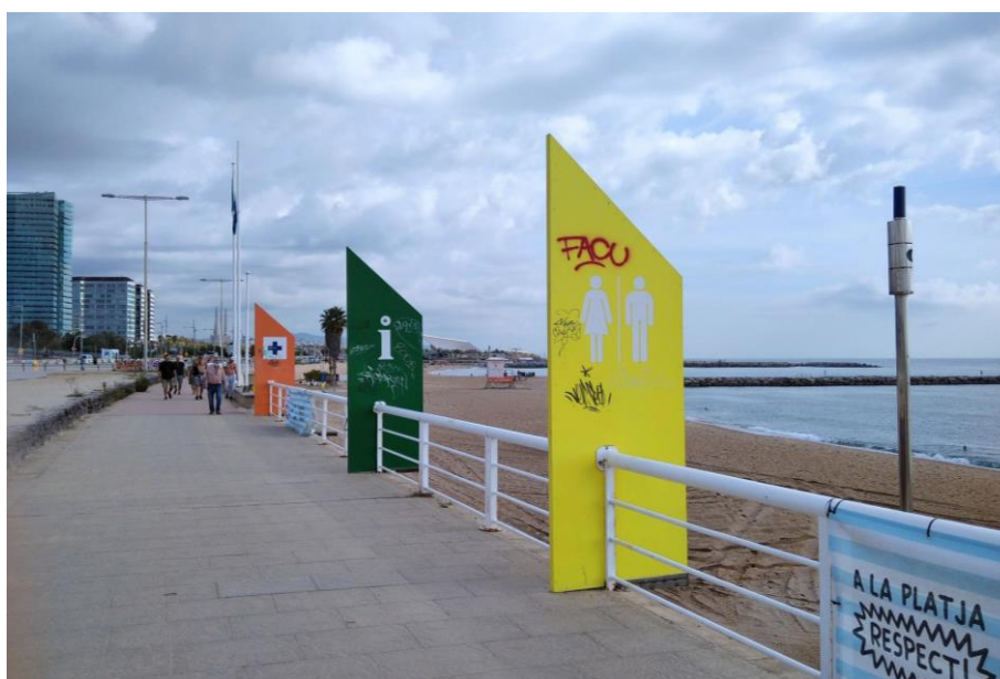
Figura 7. Tercera parada a la zona de serveis de la Platja de Llevant.

En relació amb els serveis bàsics , es comparteix que no són suficients, per això es proposa ubicar mòduls de serveis bàsics accessibles amb major freqüència que l'actual. Aquests mòduls haurien de comptar amb 3 submòduls segregats: 1. lavabo, 2. dutxa i 3. vestidor amb camilla, perquè pugui ser utilitzat per diverses persones al mateix temps. Es comenta que el lavabo accessible que s'ha fet a la Nova Icaria té el lavabo i el vestidor amb camilla junts en un sol mòdul i no pot ser utilitzat per més d'una persona, amb o sense acompanyat. Respecte a la ubicació d'aquests mòduls, es considera necessari que estiguin a cota de la Platja del Llevant (als accessos a la platja i a les plataformes d'accés al mar), i a cota del passeig del Rere Platja (en relació a les zones esportives i de joc) . Pel que fa als serveis a cota del passeig del Rere platja, es destaca la importància que s'integrin a l'entorn perquè no siguin un obstacle arquitectònic.