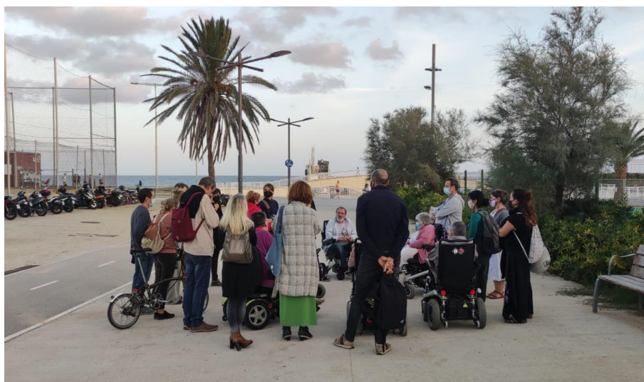
Figura 4. Primera parada a la Porta Bac de Roda.

Temes tractats : Convivència de mobilitats Percepció d'(in)seguretat Confort