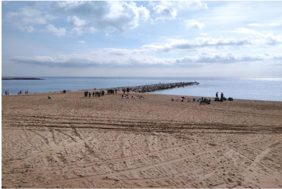
Figura 6. Accés al mar.

En relació amb l' accés al mar , es comparteix que actualment les persones són discriminades per la seva diversitat funcional, pel fet de no poder arribar de manera autònoma fins al mar. Es comparteix que la zona de bany del Fòrum i Nova Icària es consideren bones pràctiques per part del col·lectiu de persones amb diversitat funcional. Aquestes zones compten amb elements de suport que permeten arribar i entrar al mar , la qual cosa es considera una bona pràctica a replicar en totes les platges. En aquest sentit, també es proposa posar plataformes flotants de fusta dins del mar, que es muntin a l'estiu i es desmuntin a l'hivern, on puguin accedir totes les persones i tirar-se a la mar.