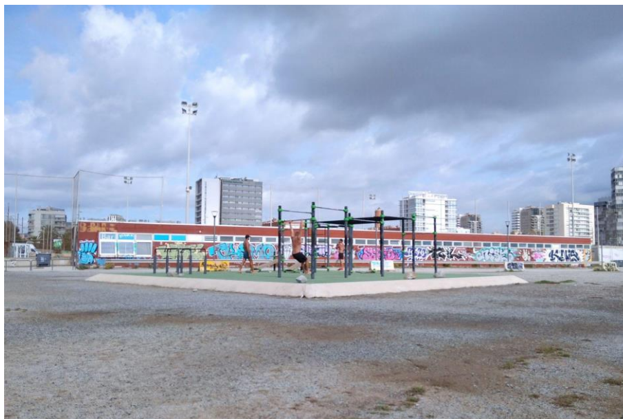
Figura 8. Zona esportiva a cota del Rere platja.

En relació amb el joc a l'aire lliure , es proposa repartir les zones de jocs infantils al llarg del litoral , garantir que tots els elements de joc siguin accessibles i estimulants: jocs d'aigua per jugar i refrescar-se, jardins sensorials per estimular els sentits, entre d'altres . Es proposa a més, incorporar bancs i fonts d'aigua en tots aquests espais.