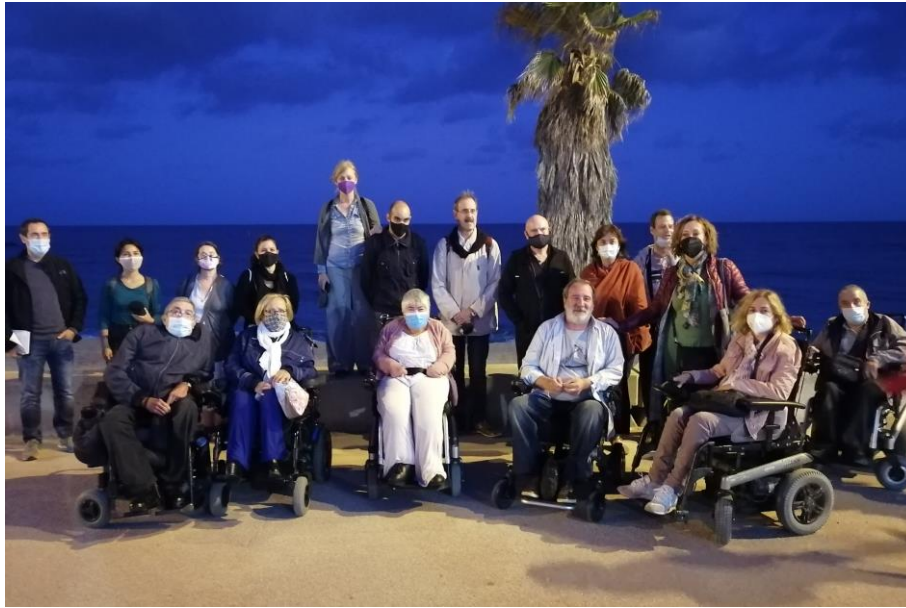
Figura 2. Foto de grup de les persones participants.