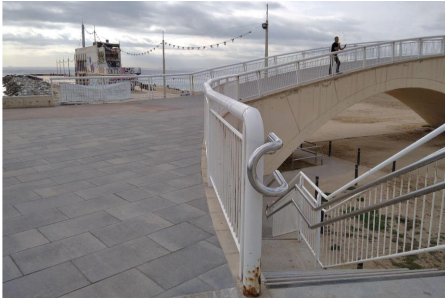
Figura 5. Pont sobre l'accés a la Platja de Llevant.

Temes tractats : Eliminació de barreres arquitectòniques Millora de la senyalització i referències